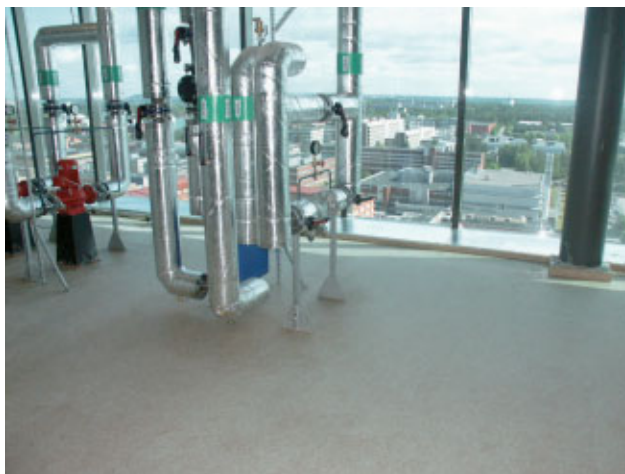
FLÄKTRUM MED SVERIGES VACKRASTE UTSIKT?

Tack vare den goda förplaneringen blev tidspressen inte särskilt betungande utan rörmontagen kunde utföras under normal arbetstid. Man valde kopparrör som rörmaterial och utförde montaget av kostnadsskäl på traditionellt vis med lödning. Det är åtskilliga tusen meter kopparrör av olika dimensioner som finns i byggnaden.